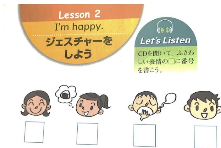
図3 「CD を聞いて、ふさわしい表情の□に番号を書こう」（『英語ノート』 p. 10）

まず、平成 21（2009）年度から配布の『英語ノート』の Lesson 2 「I’m happy. ジェスチャーをしよう」で提示されている活動内容を見ると、冒頭には「Let’s listen CD を聞いて、ふさわしい表情の□に番号を書こう」（p. 10）という活動がある。様々な表情をした4人の子どもの挿絵があり、CD からは、“Hello. How are you?” “I’m hungry. / I’m happy. / I’m sleepy. / I’m fine.” という音の流れ、各イラストの表情に合わせて番号を□に書き込むというものである（図3）。